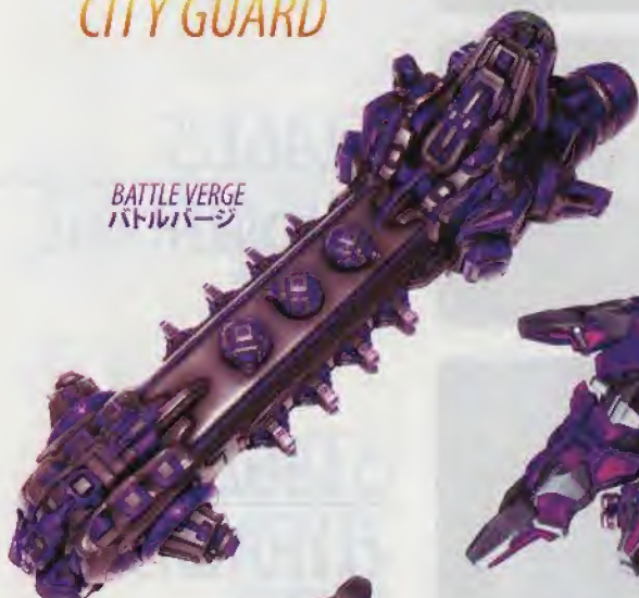
バトルバージ BATTLE VERGE